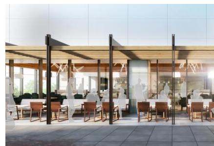
テラス席イメージ

また、ディナータイムはフリーフロー付きのメニューも用意するため、様々なシーンでご利用いただけます。