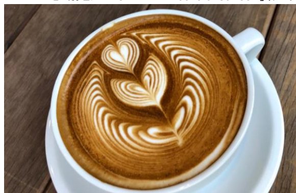
Revolver Latte イメージ

ロビーに続くゆとりある空間で、コーヒー、ラテ等はもちろん、厳選したビールやコーヒーベースのオリジナルカクテルなど新スタイルでお楽しみいただけるカフェバーです。