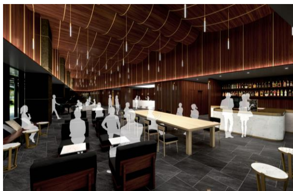
ロビーカフェ「REVOLVER - Booze & Coffee -」イメージ