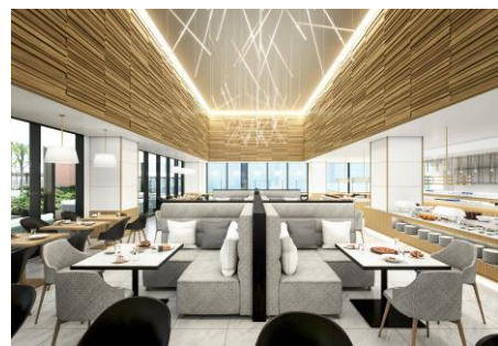
Terrace and Table 昼のイメージ

「高級食材」と「誰でも知っている親しみやすい料理」というキーワードに「フワフワ」という女性好みの感触を加えた、新感覚のオムライスです。