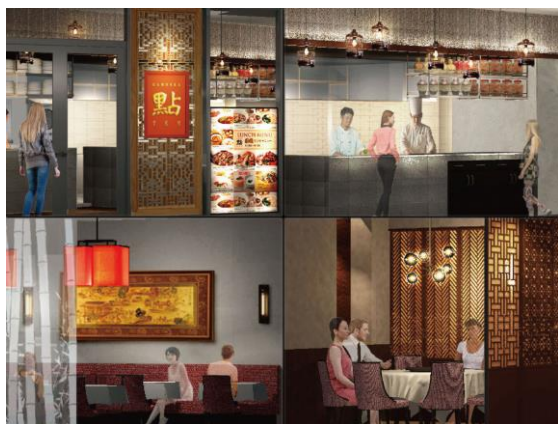
「過門香 點」店舗イメージ

中国大陸料理「過門香」がプロデュースする「過門香 點」。点心・スイーツ・飲茶を中心に、過門香の味を受け継ぐ逸品をご用意。美味しさと健康を追求したおしゃべりな中国ダイニング。心休まる空間で、気軽に味わう本格中華をお楽しみください。