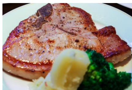
「ポークTボーンステーキ」イメージ

ハーブブッフェはランチ同様、世界各国の代表的なお料理を提供します。 土・日・祝日のディナーは季節ごとにスペシャルメニューをご用意するフルブッフェを存分にお楽しみいただけます。