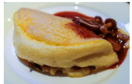
「トリュフフレオムライス」イメージ