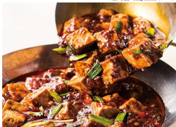
「點 麻婆豆腐」イメージ