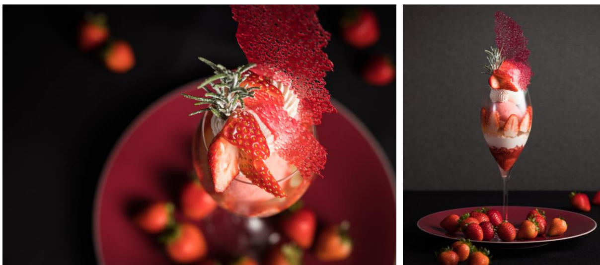
「パルフェ・オ・ルージュ」イメージ ※お皿の上および周辺の苺は撮影時のイメージ装飾です

苺、ジュレやソルベ等さっぱりとした素材の中に、白いアイスクリームのリコッタチーズ、ホワイトチョコレートのクリームといった濃厚な食材を合わせることで、パフェ全体で苺を主役としたハーモニーをお楽しみいただけます。