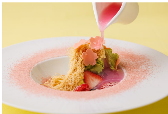
～春、満ちるひととき～桜花爛漫 （デザートプレート）