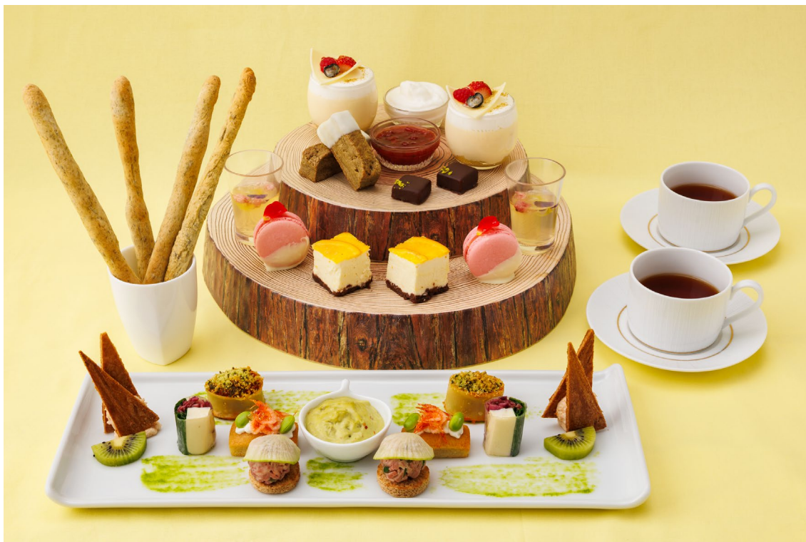
アフタヌーンティー「彩りの息吹」（Breath of Colors Afternoon Tea） （写真手前）目覚めのセイボリー／（写真奥）ひらく甘味

ホテルメトロポリタン 川崎（運営／日本ホテル株式会社、総支配人／金田 文典）の直営するオールデイダイニング「Terrace and Table」では、2025 年 3 月 2 日（月）より新作アフタヌーンティー「彩りの息吹（Breath of Colors Afternoon Tea）」を平日限定にて提供し、本日よりご予約を開始いたします。