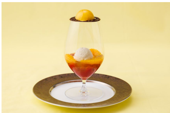
陽光にほどける彩り（ミニパフェ）