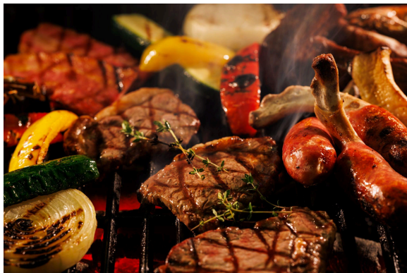
セルフスタイルBBQイメージ