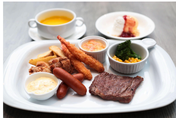
キッズプレートイメージ (写真のビーフステーキは加熱後)