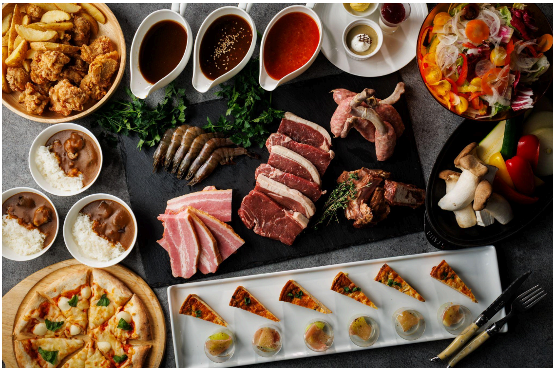
Terrace de BBQイメージ

炭起こしはホテル側で行うため、お集まりいただいた瞬間からパーティーを開始できます。お客さまご自身で焼いて楽しんでいただくセルフスタイルにて、シェフが厳選した牛サーロインや国産豚のスペアリブ、骨付きソーセージやエビ、各種野菜などボリューム満点です。サイドメニューも前菜2種盛り合わせやピザマルゲリータなどバラエティ豊かに取り揃えております。オプションで蝦夷アワビや殻付きホタテなどのシーフードもご用意可能です。ファミリー向けにキッズメニューもラインナップしました。お子さまもBBQ体験を味わっていただけるよう、ビーフステーキ用に生肉をセットにしております。テラス席が心地よいこの季節に合わせて、会社帰りの親睦会や気軽にリゾート気分を味わいたいご家族でのご利用に、開放感あるテラスでのBBQ体験をご提案いたします。