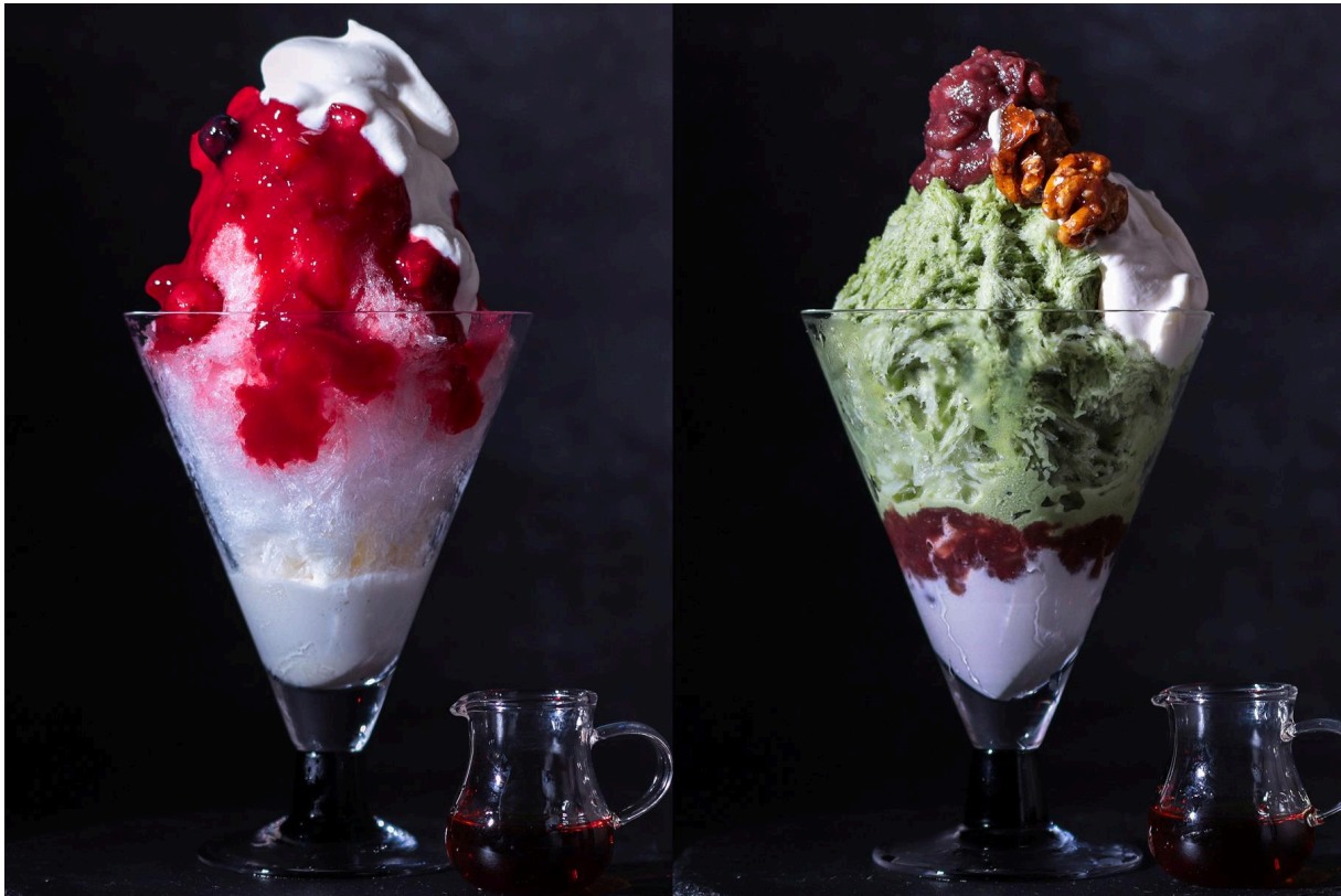
「大人の夜かき氷」イメージ

夏の猛暑対策として夜間に涼をとる「涼活」や、ナイトタイムエコノミーに対応し、女子会の2軒目に上質な「メ」を求める女性やご褒美需要に応える提案となります。