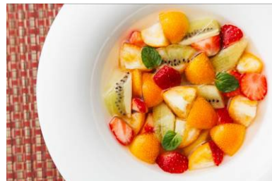
宮崎県産金柑カクテル