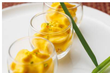
マンゴー・エスプーマ