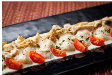
宮崎県産原木椎茸が香る 白身魚のキノコクリームソース