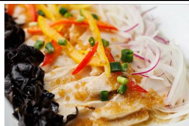
宮崎県産鶏と宮崎県産さくらげの 日向夏ドレッシング