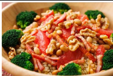
“みやだいず”ともち麦の パワーサラダ