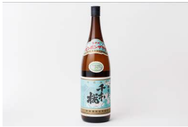
芋焼酎 母智丘 千本桜 (柳田酒造)