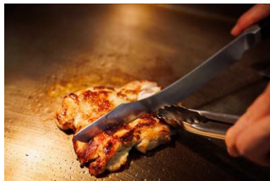
みやざき地頭鶏の塩こうじ焼き とむらのタレ