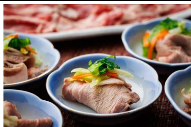
きなこ豚のしゃぶしゃぶ