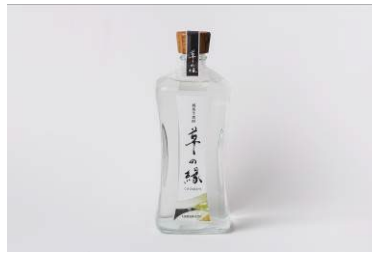
純菊芋焼酎 草の縁 (大浦酒造)

都城市の蔵元より、明治時代に創業した柳田酒造と大浦酒造の芋焼酎、麦焼酎をご提供。